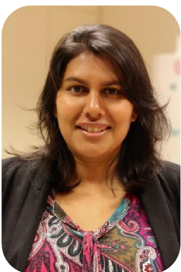
Sumi Vaste vervangster